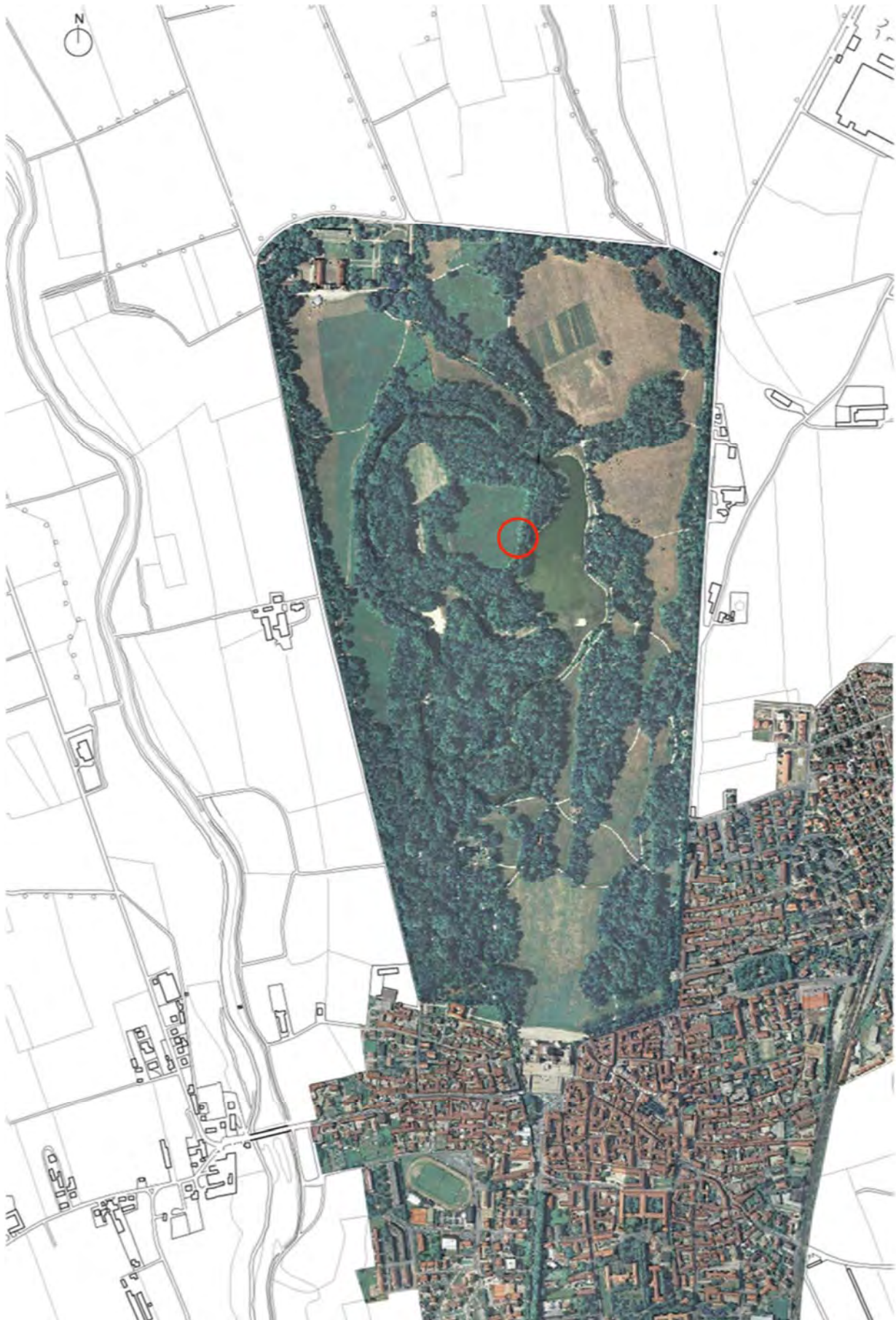
Carta tecnica regionale + ortofotocarta, fuori scala, con identificazione dell'area di progetto. Nord in alto