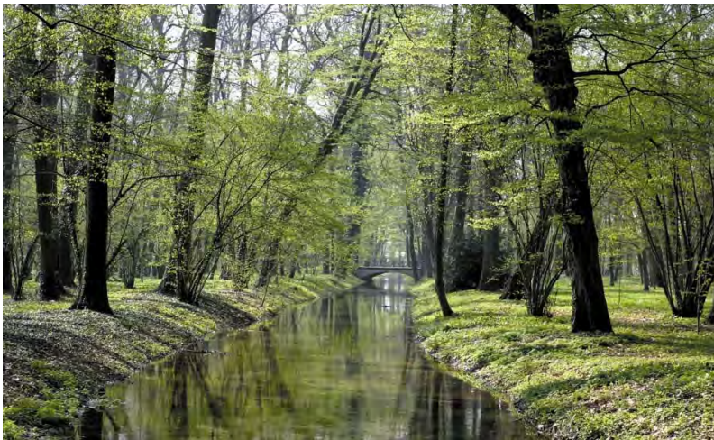
Scorcio di un canale e del patrimonio botanico del parco