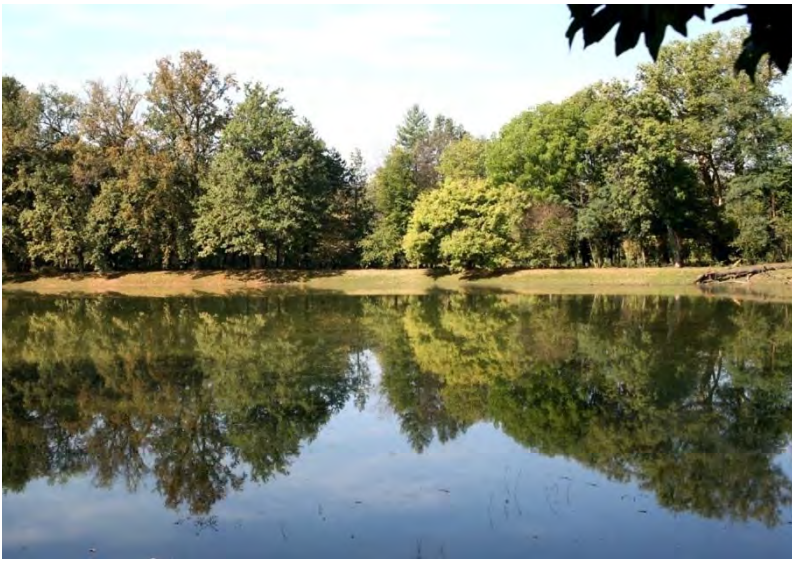
Vista da est verso ovest dell'area di progetto