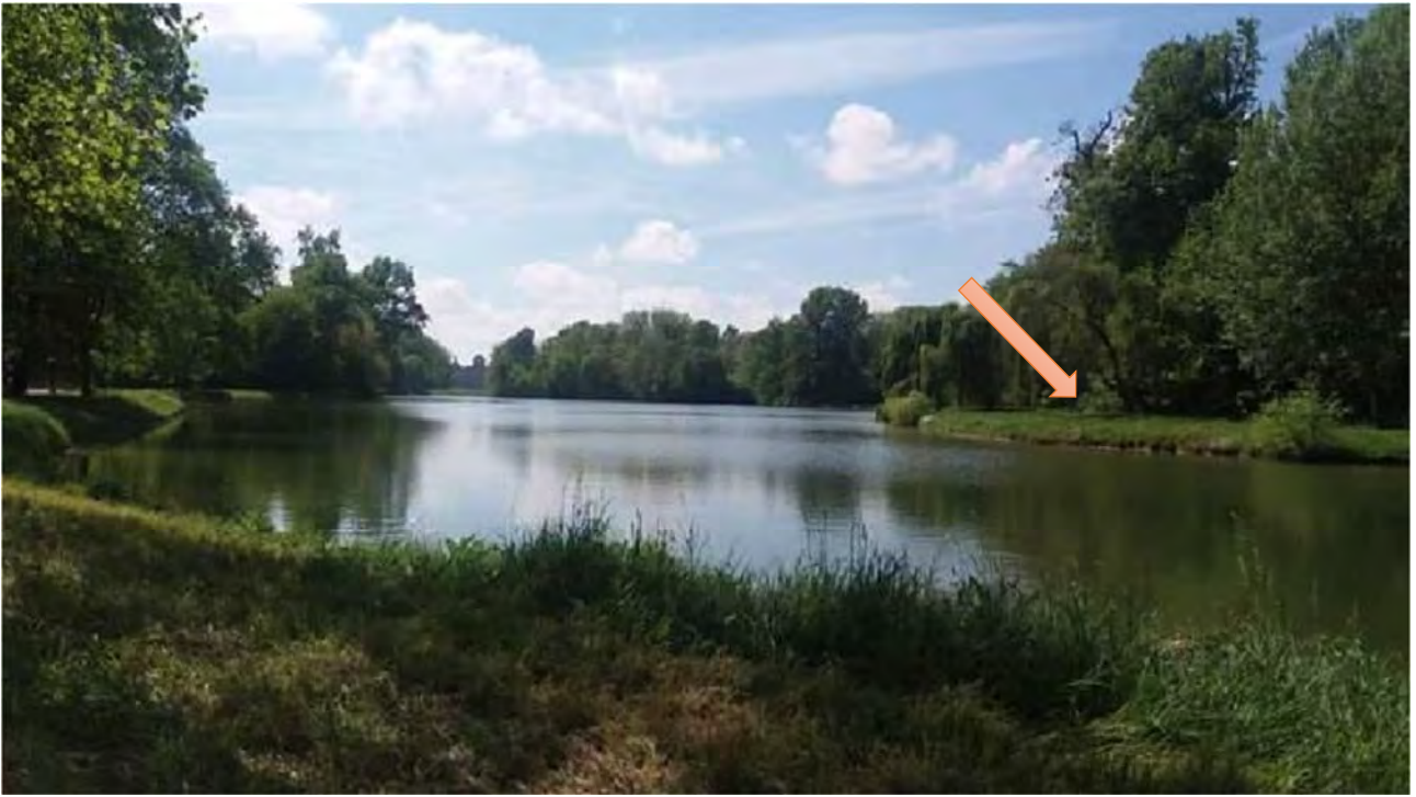
Vista d'insieme del parco, da nord verso sud, all'altezza dell'isola grande. Sulla sponda a destra, l'area di progetto.