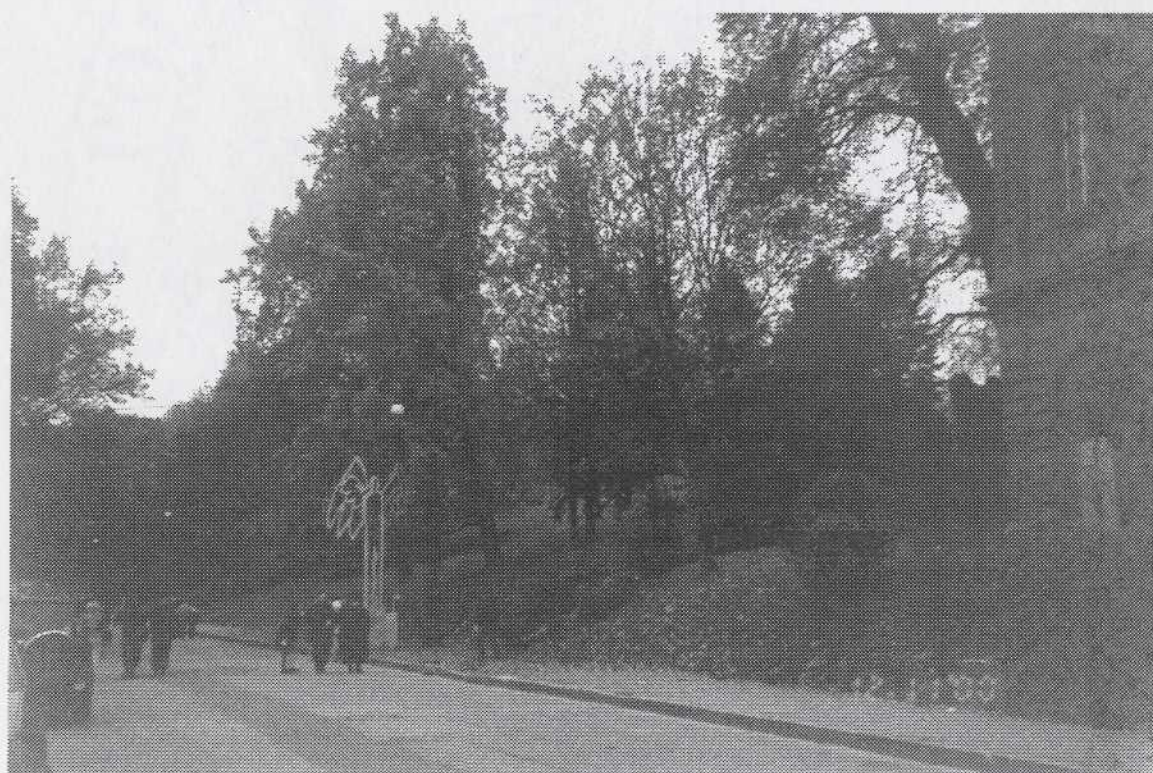
Scorcio da Nord-Est