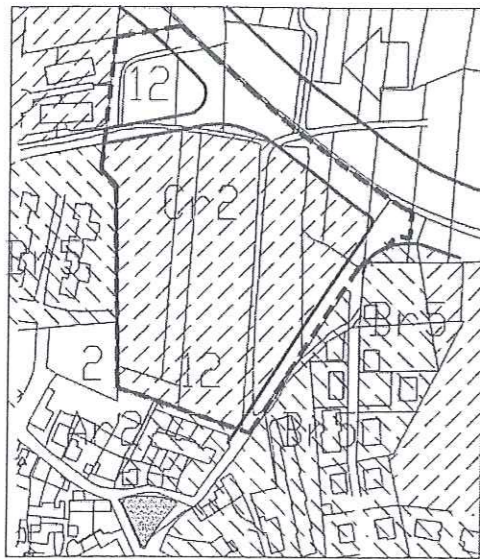
Scala : 1:5000