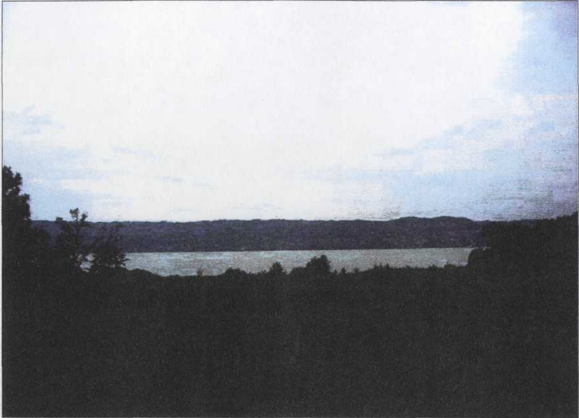
Visuale ravvicinata – area di intervento