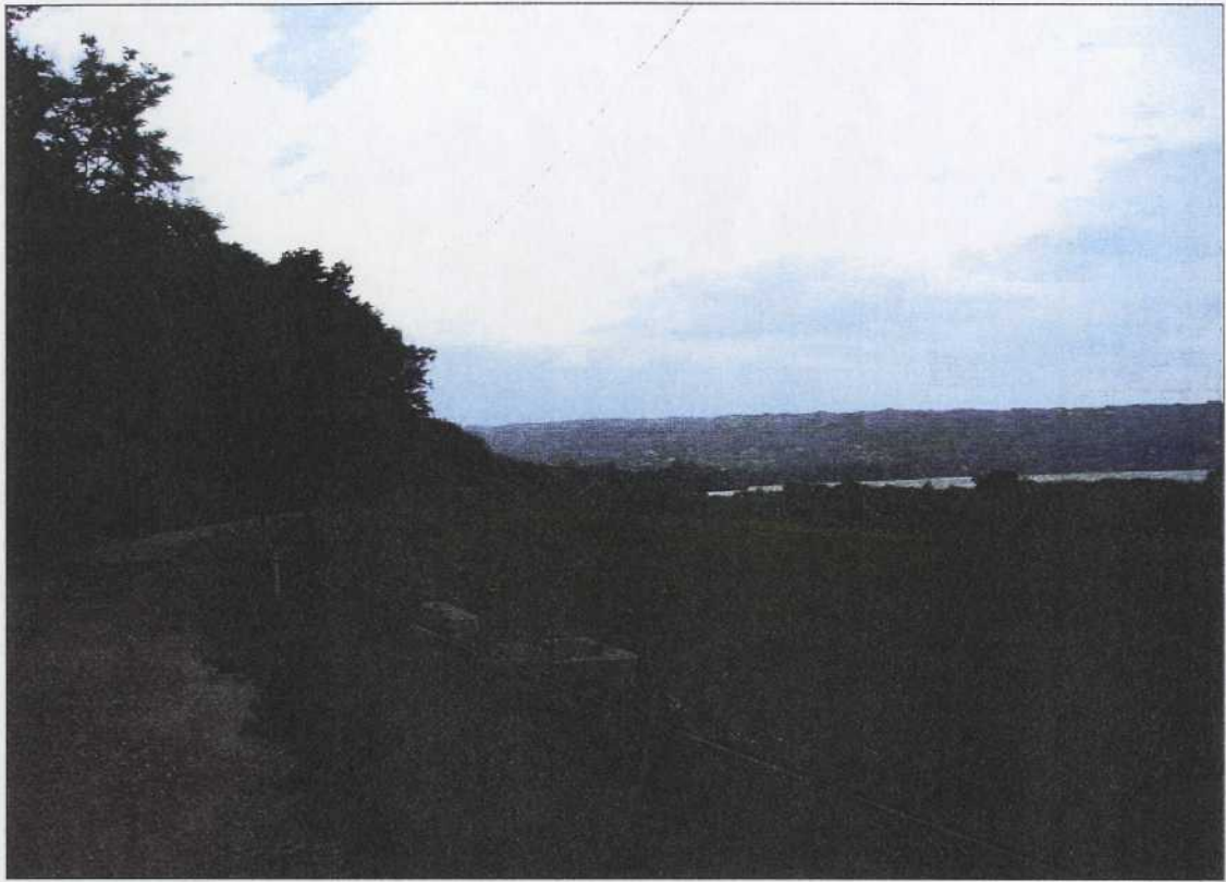
dalla Cascina Moregna - 1