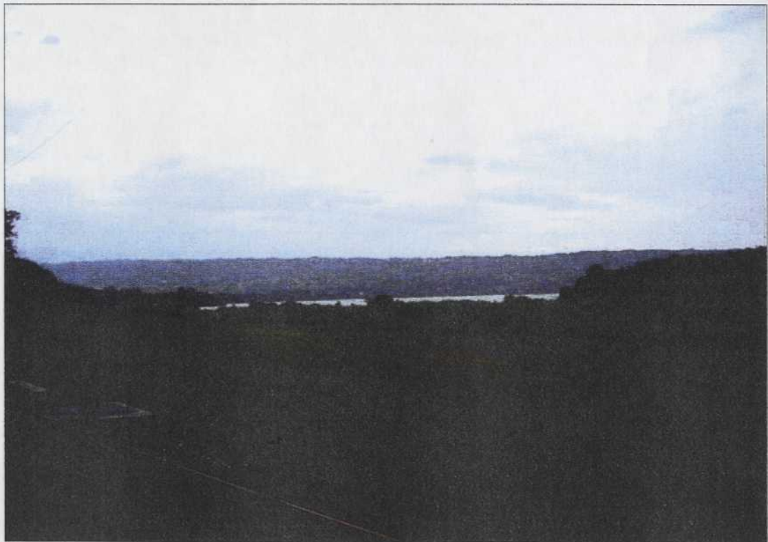
dalla Cascina Moregna - 2