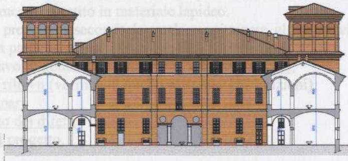
PROSPETTO SU CORTE INTERNA