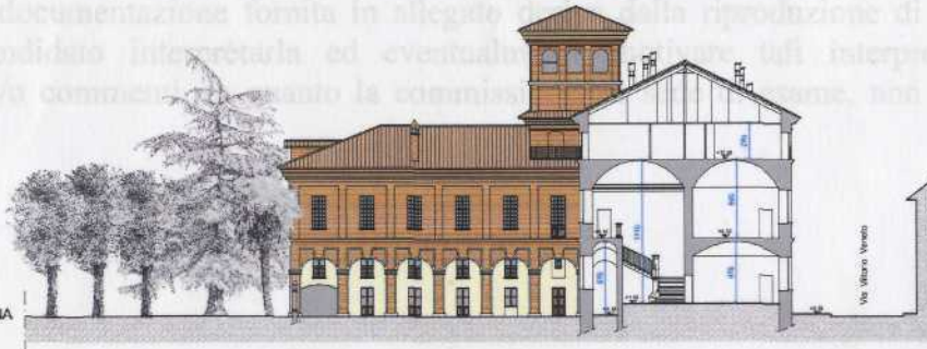
PROSPETTO MANICA SUD SU CORTE INTERNA