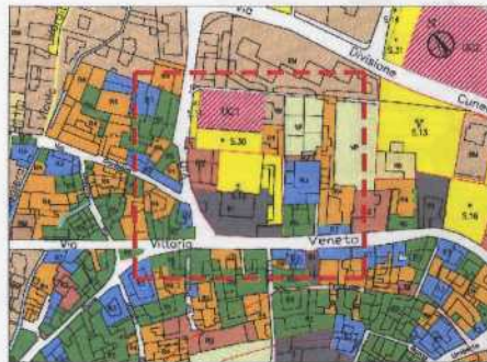
Piano Regolatore Generale - Scala 1:2000