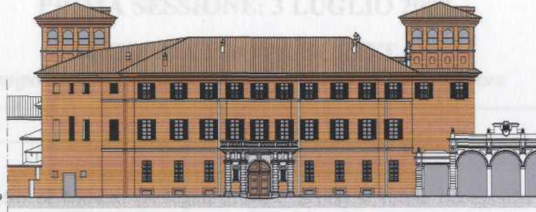
PROSPETTO SU VIA VITTORIO VENETO