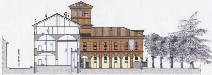
PROSPETTO MANICA NORD SU CORTE INTERNA