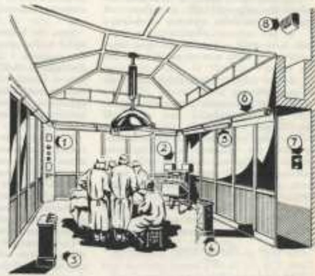
1. Generatore micronebbia - 2. Apparecchio pilota Guassardo-Sartoris - 3-4. Colonne distributrici universali Gili-Sartoris - 5. Sterilizzazione a raggi ultravioletti - 6. Illuminazione generale antistroboscopica - 7. Dufono - 8. Diffusore radiofonico.

La cella risulta dotata di una sola porta di ac-