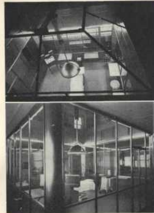
La sala operatoria vista dalla tribuna studenti e dalla galleria d'isolamento.

Per ottenere la sterilizzazione totale antibiotica o glicolica, sono stati applicati i concetti derivanti dalla esperienza acquisita nel corso della realizza-